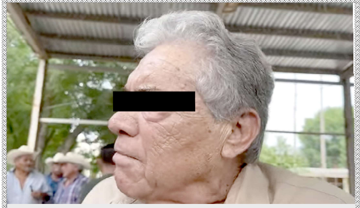
Octavio Leal Moncada, alias "El Viejo Narco"