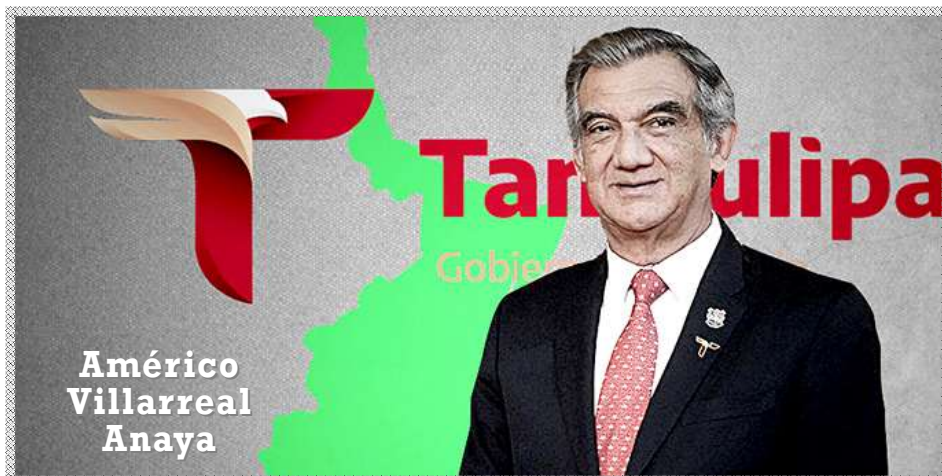
Américo Villarreal Anaya

Estados Unidos a través del Departamento de Seguridad, según fuentes consultadas al interior, aseguran que las autoridades policíacas niegan información y ocultan los resultados de la detención ejercida el fin de semana, lo que ha provocado el enojo del país vecino.