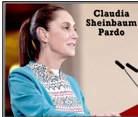
Claudia Sheinbaum Pardo

Es el brazo paramilitar de un cártel que en febrero de 2025 fue designado por el