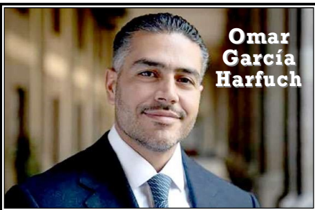
Omar García Harfuch