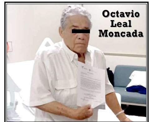
Octavio Leal Moncada

Departamento de Estado de Estados Unidos como una organización terrorista internacional.