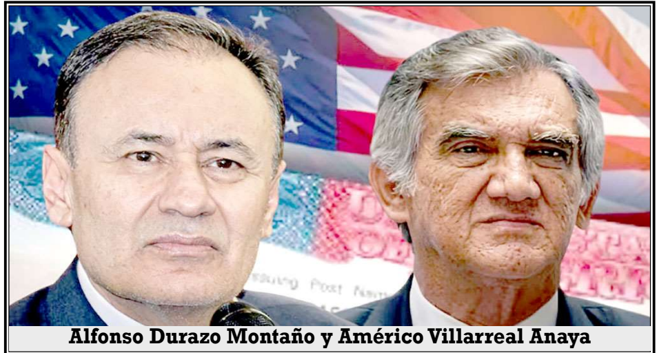
Alfonso Durazo Montaño y Américo Villarreal Anaya

La polémica se desató tras un reportaje de Los Angeles Times que afirmaba que