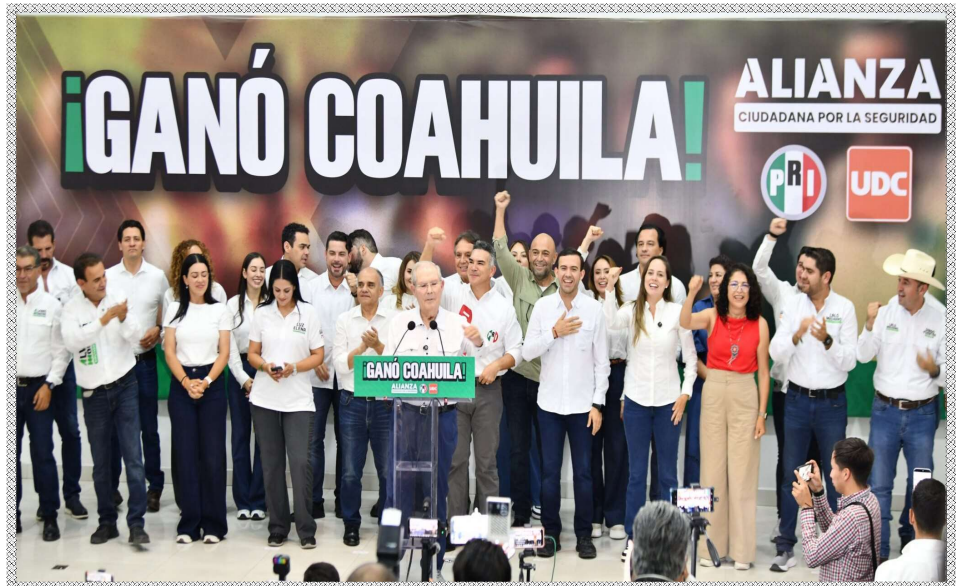
ra el porcentaje mínimo requerido para mantenerse como fuerza política estatal.

En otras palabras, seguirán apareciendo en las boletas federales porque conservan su registro nacional, pero en Coahuila los electores les enviaron un mensaje muy claro: no alcanzaron ni siquiera