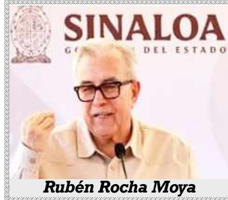
Rubén Rocha Moya