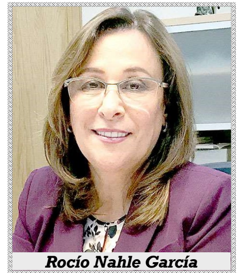
Rocío Nahle García