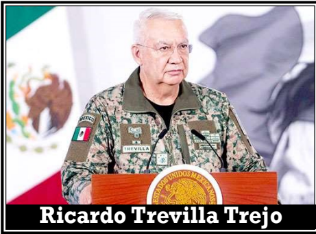
Ricardo Trevilla Trejo