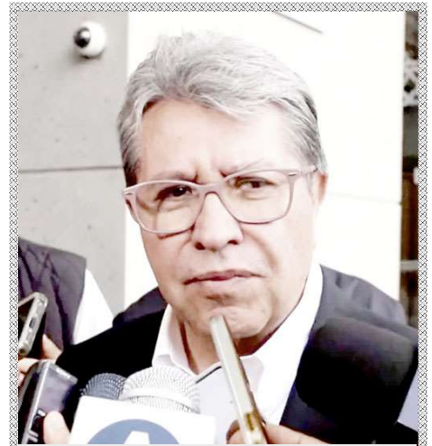
Ricardo Monreal Ávila

Según Carter , la localización del objetivo fue