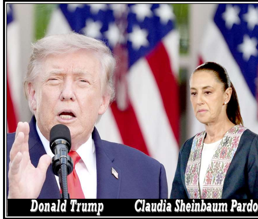
Donald Trump Claudia Sheinbaum Pardo