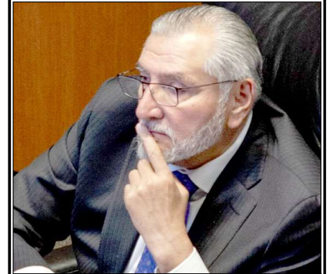
Adán Augusto López Hernández